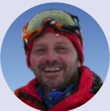
Werner Kiem Biathlon Sportler, 1x Bronze Olympia, 1x Silber WM