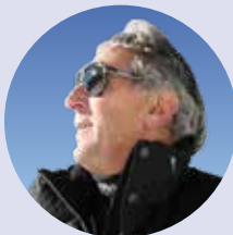
Roland Thöni 2x Weltcup Siege 1x Bronze Olympia